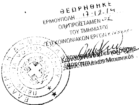
Αχιλλέας Τηλέγραφος Πολιτικός Μηχανικός